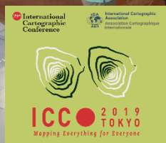
テレコムセンタービル会場での国際地図展 (2019年7月18日撮影)