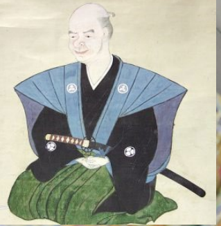
『長久保赤水像(自画自賛)』 (高萩市歴史民俗資料館蔵)