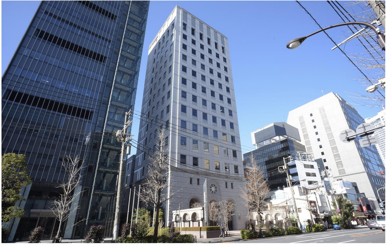
2022年 日本地図学会 定期大会 都内地図・図書展会場 日本大学経済学部7号館